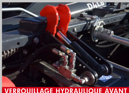
VERROUILLAGE HYDRAULIQUE AVANT