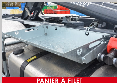
PANIER À FILET